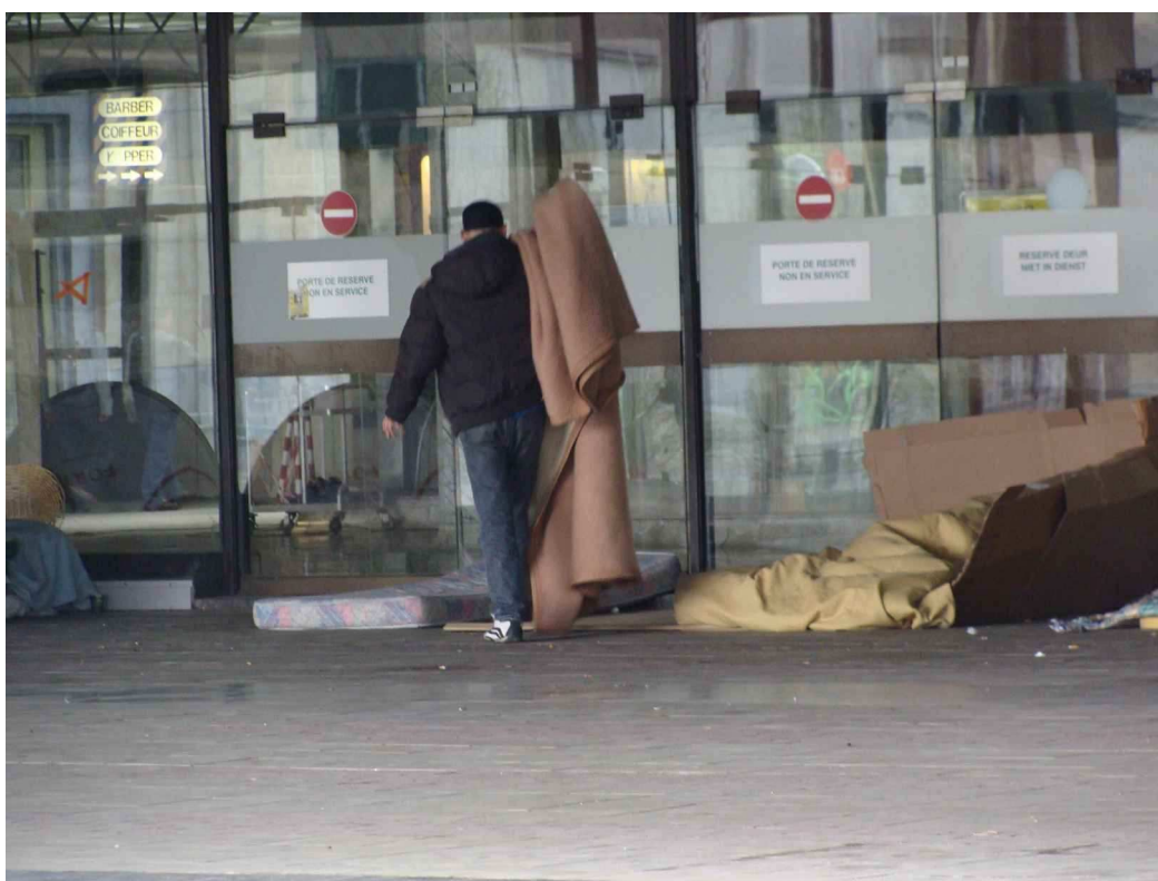
april 2010